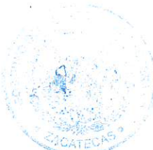
DIP. JOSÉ GUADALUPE CORREA VALDEZ