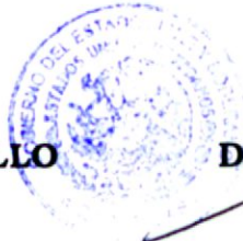
DIP. RAÚL UELOA GUZMÁN